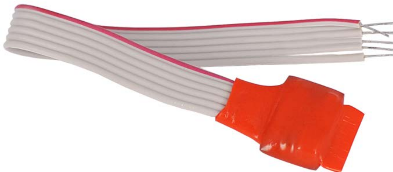
Рисунок 2.2.1 Внешний вид АР1

На рисунке 2.2.1 представлены внешний вид АР1.