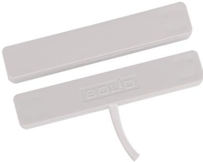
Рисунок 2.2.2.1 Внешний вид С2000-СМК