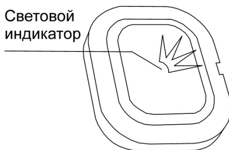
Рисунок 2.1 Внешний вид

В верхней части лицевой панели находятся паз для открывания корпуса при помощи отвёртки с плоским наконечником.