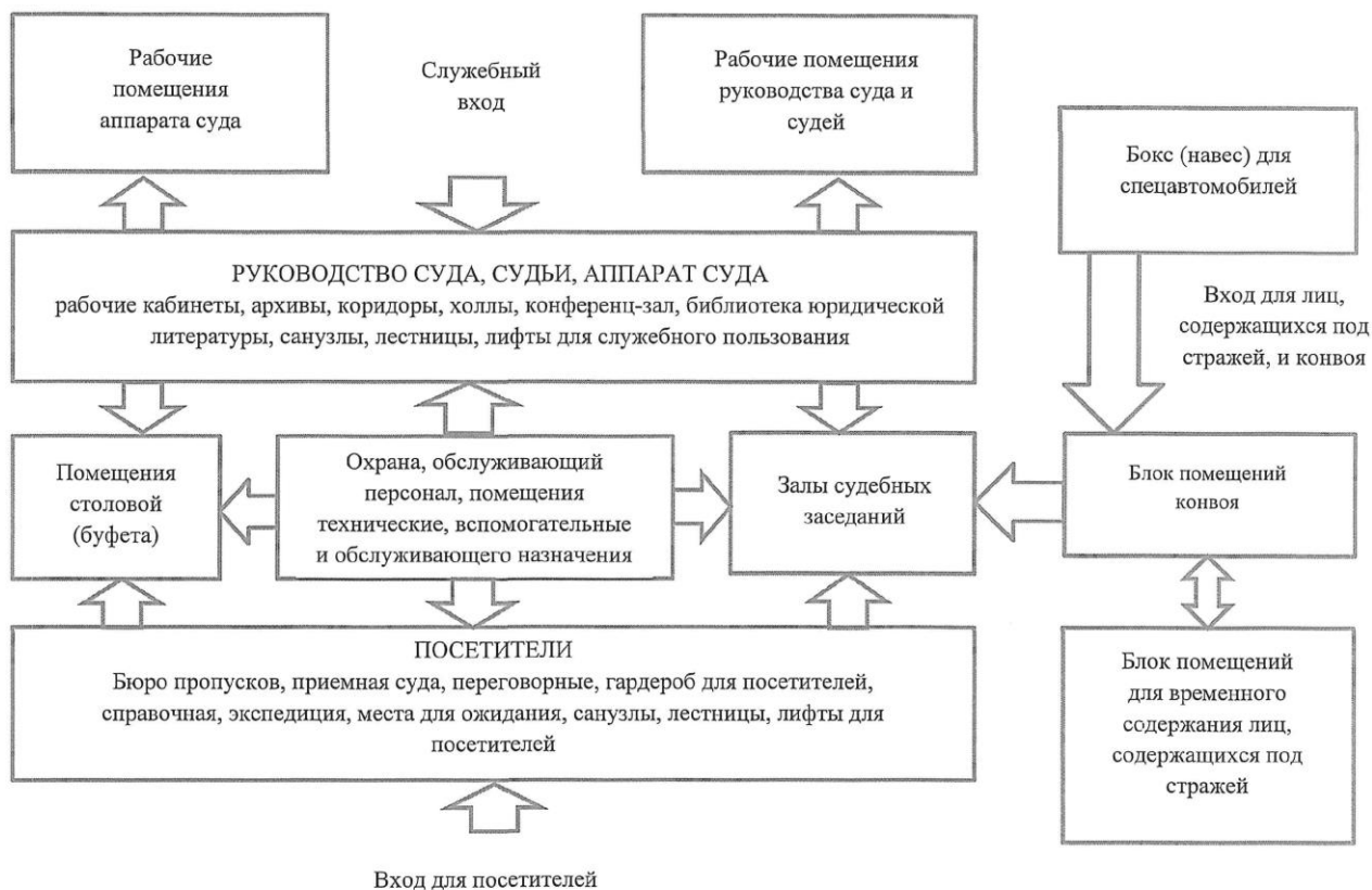
Рисунок 6.1 – Схема функциональной взаимосвязи основных групп помещений зданий судов (для арбитражных судов без блока помещений для конвоя и лиц содержащихся под стражей)».

6.4 При проектировании вновь строящихся зданий федеральных судов высоту рабочих помещений в чистоте (от пола до потолка) следует принимать не менее 3 м в соответствии с СП 118.13330. Высота залов судебных заседаний и конференц-залов с количеством посетителей 75 человек (мест) и более определяется проектным решением по условиям видимости.